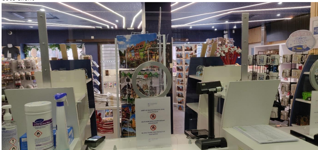
Côté conseiller de vente

Nous privilégions les paiements sans contact (téléphones mobiles, cartes bancaires). Depuis le 11 mai 2020, le plafond du paiement sans contact par carte bancaire est passé de 30€ à 50€. L'incitation au paiement dématérialisé est rappelée sur les écrans situés au-dessus des caisses.